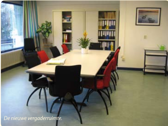
De nieuwe vergaderruimte.