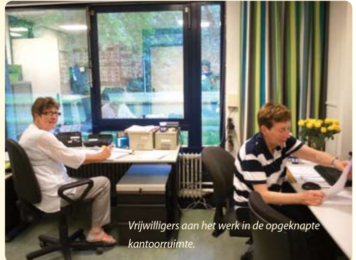
Vrijwilligers aan het werk in de opgeknapte kantoorruimte.